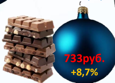
Конфеты шоколадные (кг)